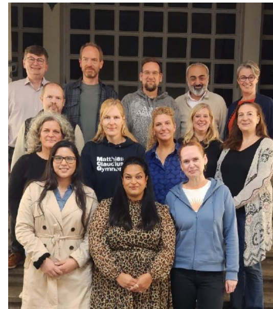
Elternrat + Schulverein