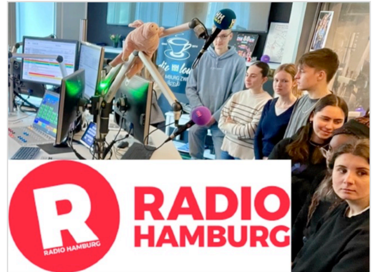
Medienprofil bei Radio Hamburg